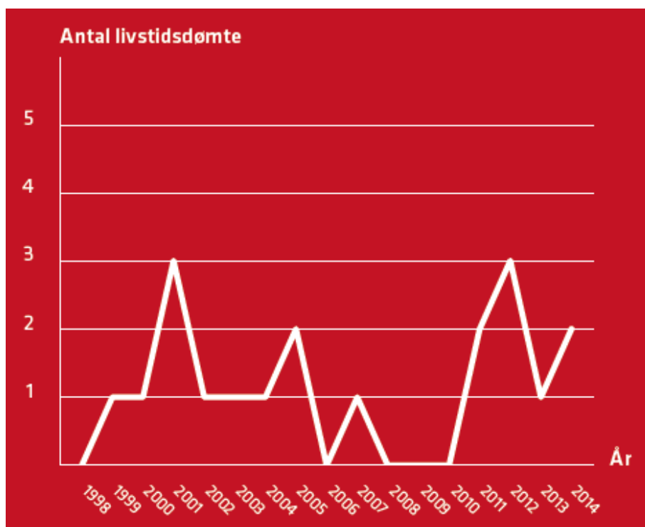
Kriminalitet, Danmarks Statistik, 1998-2014.

Anstalten ved Herstedvesters hjemmeside, 2016.