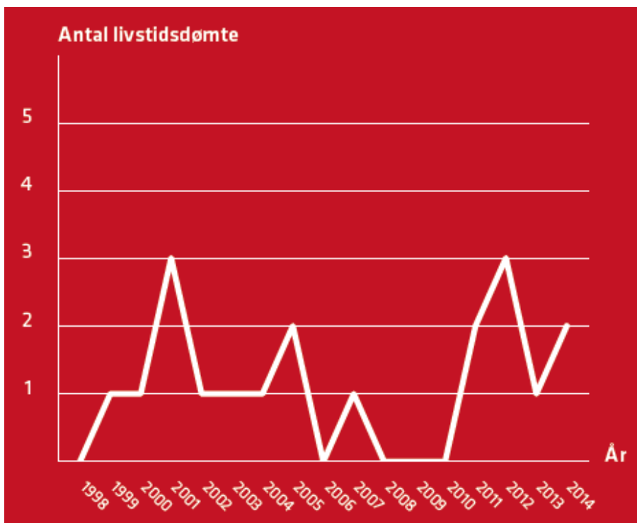
Kriminalitet, Danmarks Statistik, 1998-2014.

Anstalten ved Herstedvesters hjemmeside, 2016.